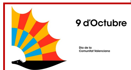
Cartell campanya 9 d'octubre

A més, enguany es va presentar una campanya institucional amb el drac alat com a símbol.