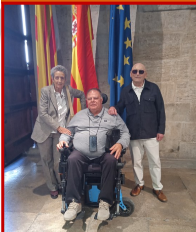
CVPM en la recepció del 9 Octubre

Una representació del Consell Valencià de Persones Majors va acudir el pas-