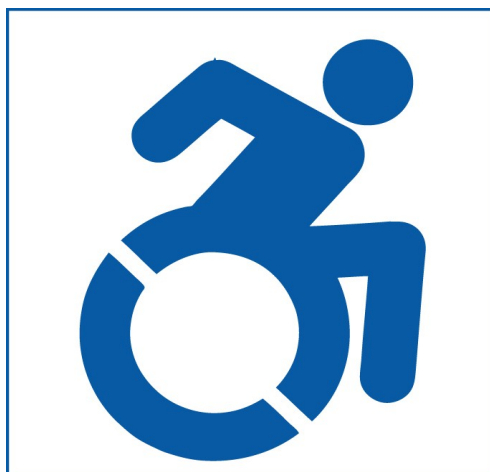
Fig. 6. Icona a emprar en instal·lacions esportives accessibles