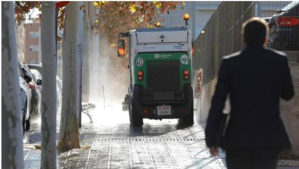
Una máquina del servicio de recogida de residuos en Tarragona.

31 enero 2024 20:55 | Actualizado a 31 enero 2024 21:30