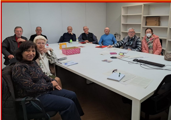
Comisión permanente 28 de febrero

El día 28 de febrero, el Consejo Valenciano de Personas Mayores celebró la sesión de la Comisión Permanente, donde revisamos la actividad llevada a cabo por el Consejo en el último trimestre.