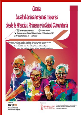
Cartel de la charla

La sanidad y la salud comunitaria en las personas mayores a debate.