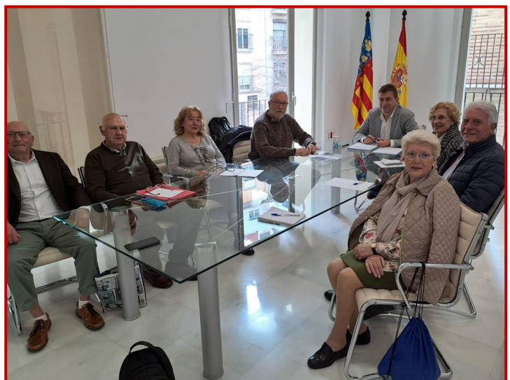
Asistentes a la reunión del 9 de febrero