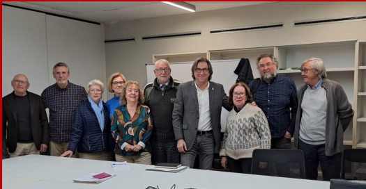
Asistentes a la reunión del 18 de enero