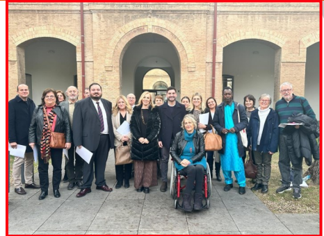
Asistentes a la reunión del 6 de febrero

También se planteó para que se traslade a la Conselleria de Sanidad, la situación de discriminación de las personas mayores respecto a las pruebas preventivas de cáncer. A las personas que superan los 69 años se les excluye del sistema sanitario preventivo, por tanto solicitamos de Sanidad, que siga las recomendaciones de la Unión Europea y de la OMS, y que se amplíen los plazos.