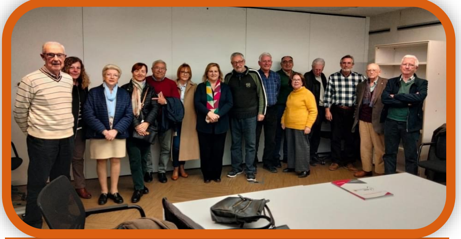
Asistentes a la reunión del 5 de marzo

El Consejo y las organizaciones de personas mayores que lo componen, le hemos trasladado las necesidades y preocupaciones que tenemos, ante la falta de plazas públicas en residencias y centros de día y la necesidad urgente de crear un Plan de Infraestructuras Sociales Valenciano, que reduzca esta necesidad en los municipios y en las zonas rurales.