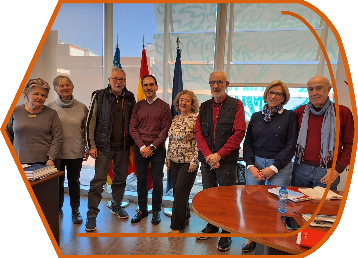
Asistentes a la reunión del 22 de diciembre

Una representación del Consejo Valenciano de Personas mayores se reunió el 22 de diciembre con el Comisionado para la Lucha contra la Violencia sobre la mujer, Felipe del Baño, de la Generalitat Valenciana, para manifestar su preocupación ante el elevado porcentaje de mujeres mayores que sufren violencia.