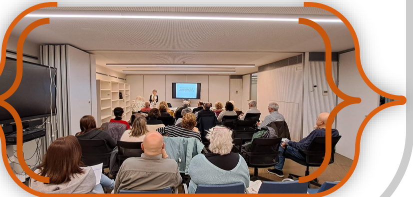
Jornada sobre dependencia

La jornada, muy importante para las personas mayores, fue seguida con interés los miembros del Consejo y los de las organizaciones y entidades del sector de Personas Mayores.