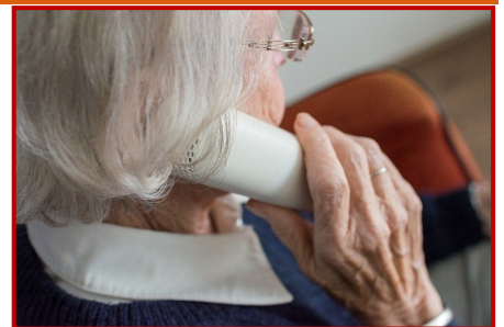
8 de marzo: día de la mujer

Por eso tantas mujeres han padecido y padecen calladas la violencia de que algunas son objeto.