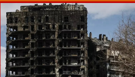
Incendio de Campanar

Tristeza, dolor, cercanía a las víctimas y a sus familiares, son los sentimientos que hoy