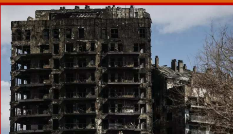
Incendi de Campanar

viu el Consell Valencià de Persones Majors.