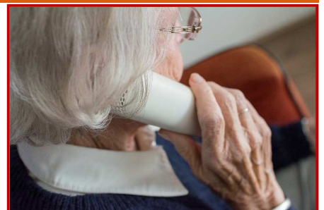
8 de març: dia de la dona

Per això tantes dones han patit i patixen callades la violència de què algunes són objecte.