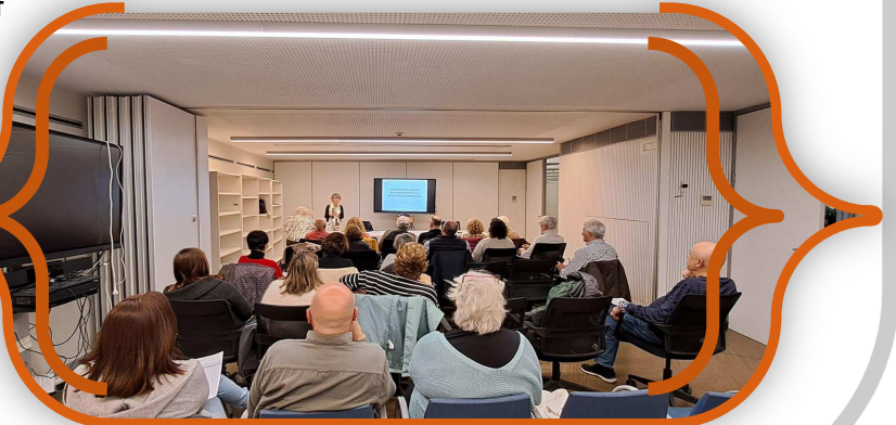
Jornada sobre dependència

La jornada, molt important per a les persones majors, va ser seguida amb interès els membres del Consell i els de les organitzacions i entitats del sector de Persones Majors.