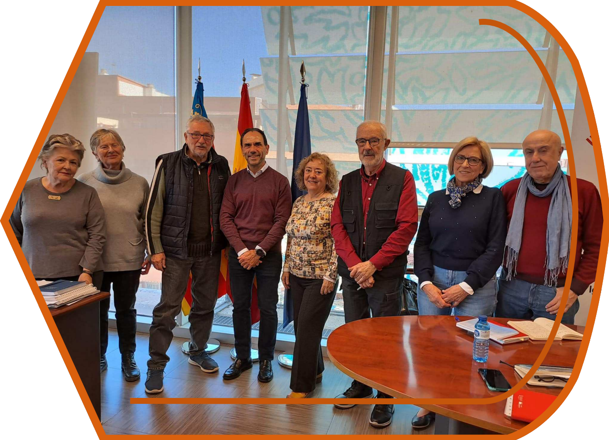
Assistents a la reunió del 22 de desembre