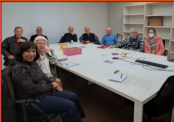
Comissió permanent 28 de febrer

El dia 28 de febrer, el Consell Valencià de Persones Majors va celebrar la sessió de la Comissió Permanent, on revisarem l'activitat duta a terme pel Consell en l'últim trimestre.