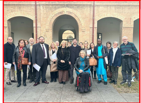
Assistents a la reunió del 6 de febrer

acollides pels responsables del Govern, per a traslladar-les a les conselleries i informaran el CVPM sobre aquest tema.