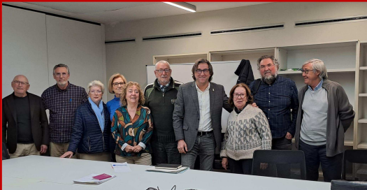
Assistents a la reunió del 18 de gener