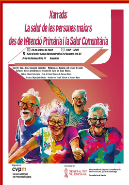
Cartell de la xarrada

La sanitat i la salut comunitària en les persones majors a debat.