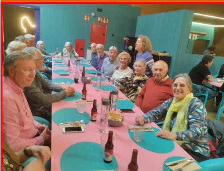
Assistents a la reunió de 13 de desembre

Ple de Consell Valencià de Persones Majors per a donar compte de les activitats realitzades durant l'any.