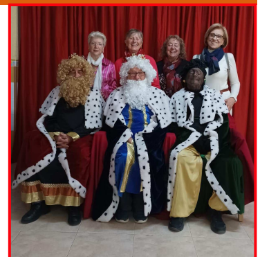
Reis mags del CVPM

Ens hem sentit molt feliços, portant il·lusió i alegria a estos xiquets, xiquetes i profes-