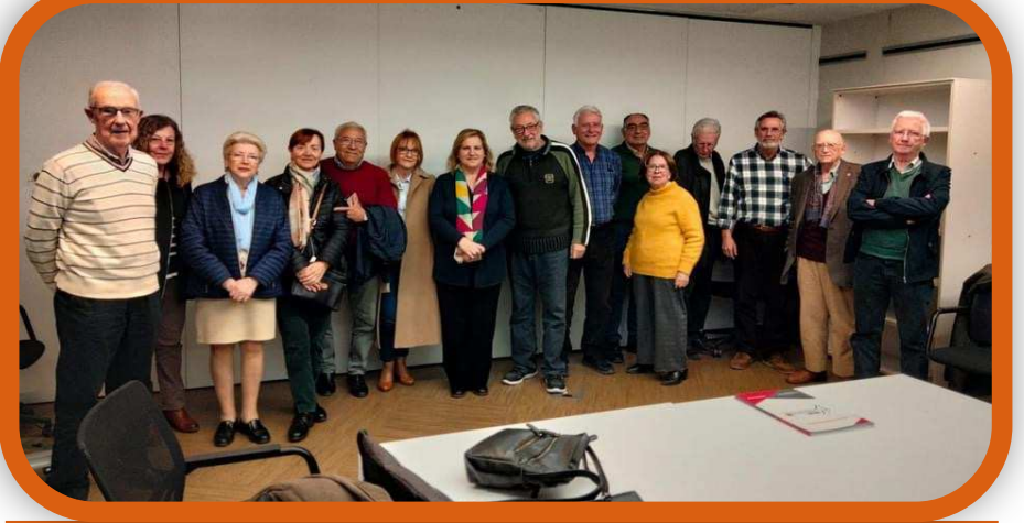
Assistents a la reunió del 5 de març

El Consell i les organitzacions de persones majors que el componen, li hem traslladat les necessitats i preocupacions que tenim, davant la falta de places públiques en residències i centres de dia i la necessitat urgent de crear un Pla d'Infraestructures Socials Valencià, que reduísca esta necessitat en els municipis i en les zones rurals.