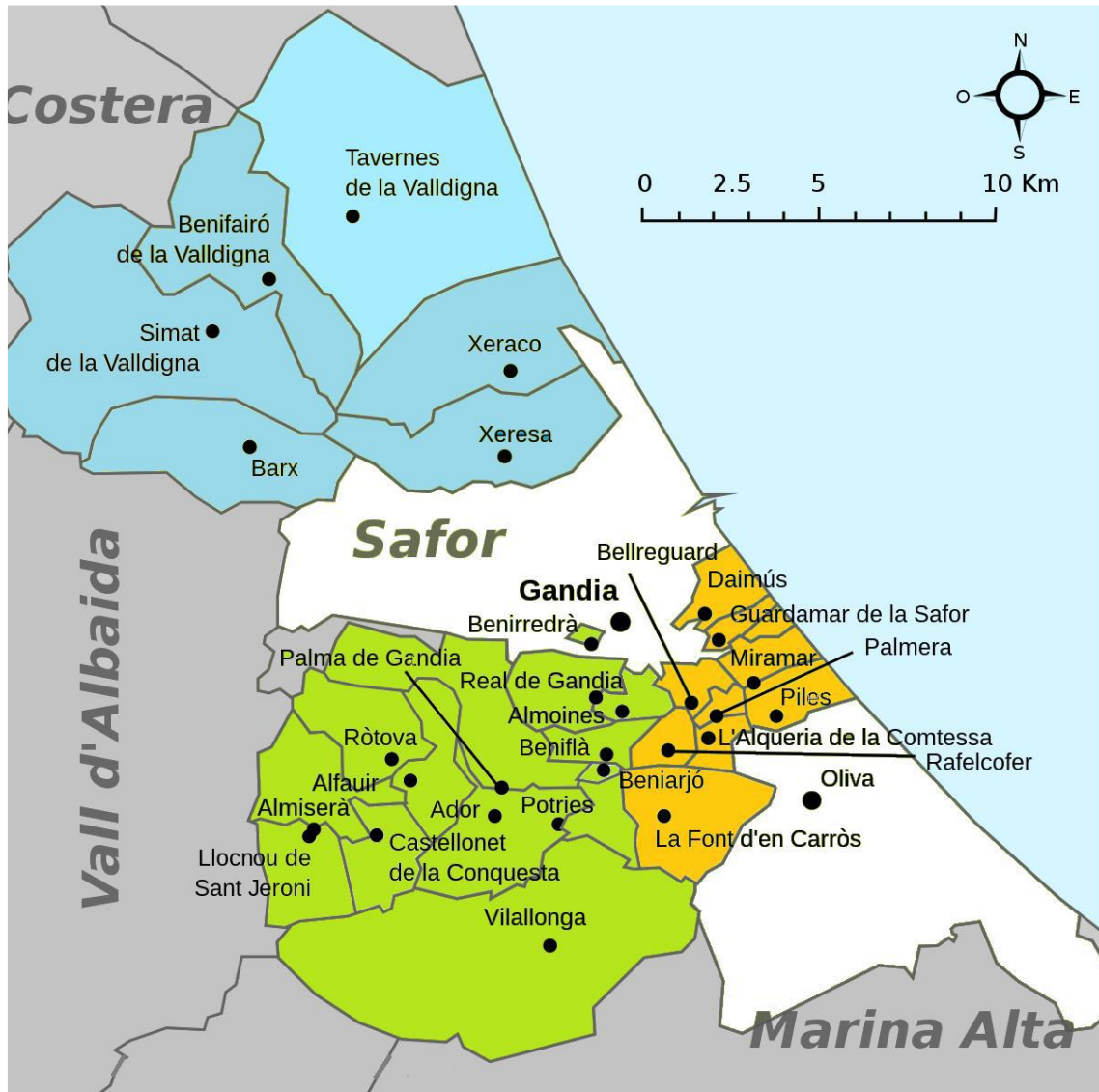
Taula 1: Annex II del Decreto 34/2021, de 26 de febrer, del Consell