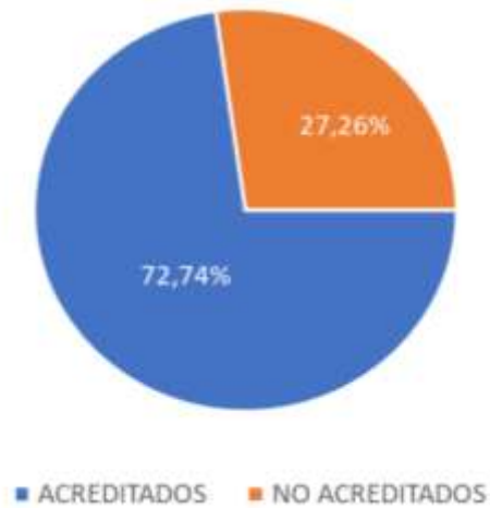
Gráfico 3- Resultado de solicitudes de acreditación, acumuladas desde 2011