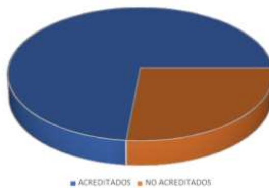
Gráfico 3- Resultado de solicitudes de acreditación, acumuladas desde 2011