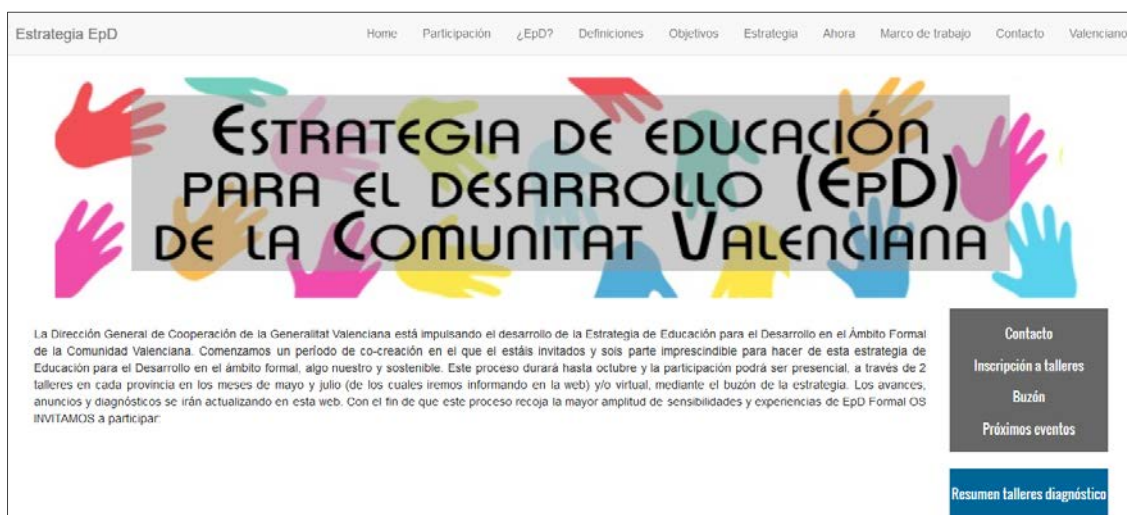
Imagen 1. Página web de la Estrategia