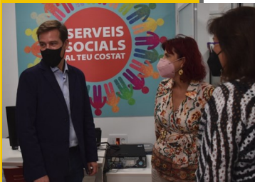
Visita PEF Xàtiva

Sin duda alguna, la implantación del nuevo modelo de Puntos de Encuentro Familiar está siendo posible por la cordial colaboración entre la Generalitat y ayuntamientos que priorizan en sus actuaciones a las niñas, niños y adolescentes, ciudadanos menores de edad con derechos.