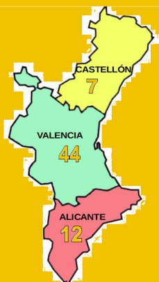
Solicitudes por provincia

Finalizado el periodo para presentar solicitudes el 3 de agosto, en la siguiente tabla se resumen las solicitudes recibidas por provincia y programa: