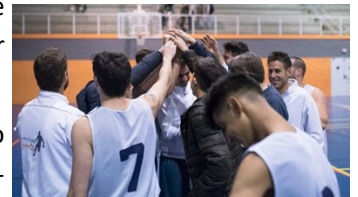
Equipo de baloncesto

Talleres manipulativos: fallas, regalos, manualidades, yumping, papiroflexia