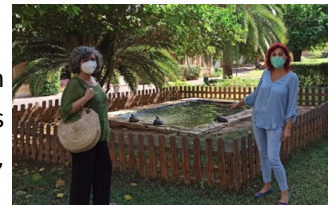
Colonia San Vte. Ferrer