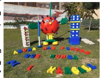
Pi i Margall