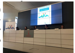
Jornada justicia juvenil