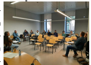
Jornada justicia juvenil

En la Jornada participaron más de 80 profesionales que trabajan en la atención socioeducativa y fue un punto de trabajo conjunto, de propuestas e intercambio de experiencias para seguir mejorando el desempeño la agrupación profesional que se realiza.