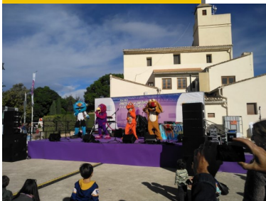
Actuación en Viveros

En cuanto a la participación se contabilizaron más de 2000 personas.