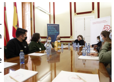
Consejo Infancia y Adolescencia CV con Mónica Oltra