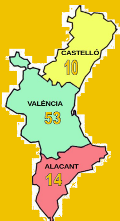
Solicitudes por provincia

La información completa sobre la subvención se puede consultar en este apartado web .