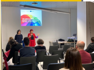
Reunión en València

El contenido de estas sesiones versó sobre la participación infantil y las herramientas que favorecen la misma a la par que se profundizó en el Consejo Infantil y Adolescente del Sistema de Protección: composición, duración del mandato y renovación, funciones del CIASP, designación de personas integrantes... remarcando los aspectos que marcaba el borrador de la convocatoria.