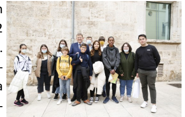
Consejo Infancia y Adolescencia CV con Ximo Puig

Deseamos a los consejeros y consejeras un buen verano y nos quedamos con ganas de reencontrarnos pronto en el mes de septiembre.